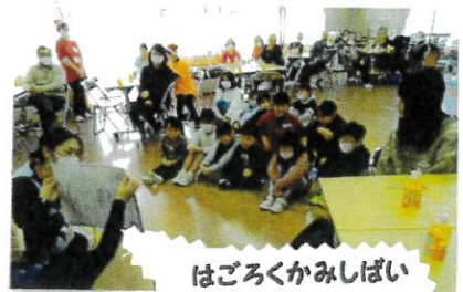
はごろくかみしばい