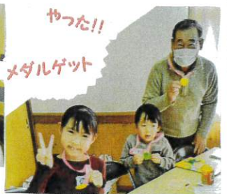
やった!! メダルゲット