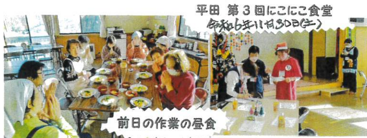
平田 第3回にこにこ食堂 令和6年11月30日(土)