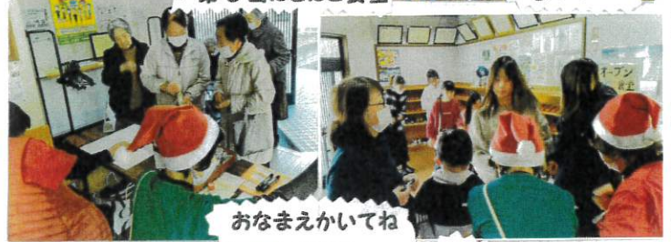
おなまえかいてね