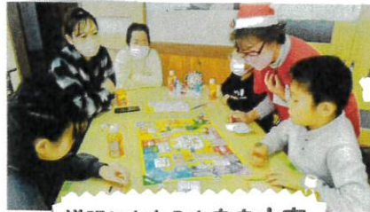
説明にあたふたああ大変