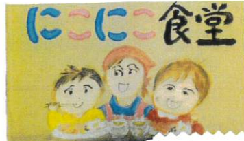
第3回にこにこ食堂