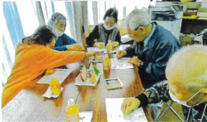
だい盛会に無事終了